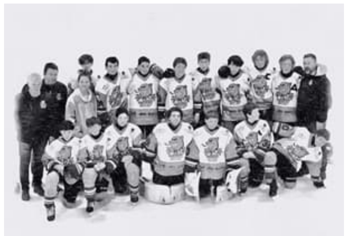
Notre équipe U15 termine au pied du podium lors du tournoi international de Champéry, les 25 et 26 mars.

Nos U15A a eu un rendement en dents de scie. Dommage, notre équipe aurait mérité mieux. Notons tout de même que certains U13 Elit ont pu profiter de pas mal de temps de glace et qu'ils y ont fourni de bonnes prestations.