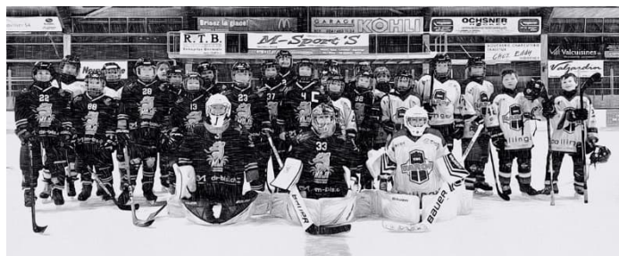
Match très amical entre nos U13A et les Top de Raron, des sourires des deux côtés et un excellent souvenir.

Afin de donner du temps de jeu à quelques-uns de nos joueurs, une collaboration avec le EHC Raron a été conclue en U13 Top. Bien que cela ait été très difficile, nos juniors ont eu l'immense mérite de ne jamais abandonner. Un excellent état d'esprit digne des meilleurs.