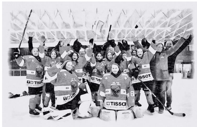
Les Chouettes de Suisse Romande, une première historique

D'un point de vue global, les organisateurs de cette 63 ème édition sont plus que satisfaits et qualifient de succès la division féminine. 12 équipes se sont disputé le premier titre de la catégorie et, selon leurs aptitudes, ont toutes réussies à se démarquer, à leur façon. C'est le West Lightning de Durham (Ajax en Ontario) qui grave son nom sur le trophée, ce qui reste anecdotique, le principal gagnant étant le hockey féminin !