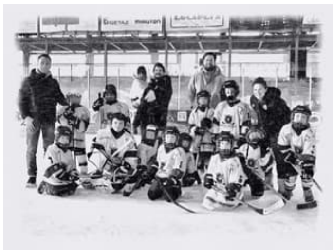
Tournoi U7, le 2 avril 2023. Nos petites étoiles ont brillé de mille feux sur la glace de Villars !