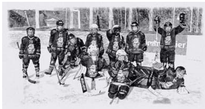
U11-2 en verve à Vissoie le 18.12.2022