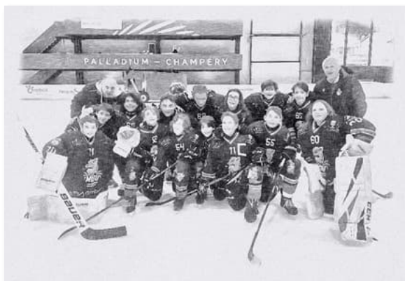
Champéry, les U13 en bronze après un parcours admirable.

Plusieurs joueuses / joueurs de U13A ont été alignés avec les « Elit » cette saison et, même s'il reste beaucoup de travail, c'est très encourageant pour les saisons à venir.