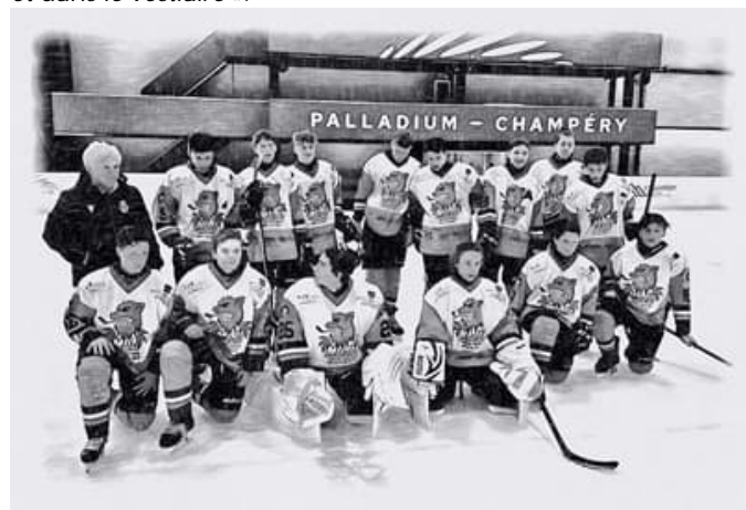
Nos U17, 3 ème à Champéry lors du tournoi de fin de saison.