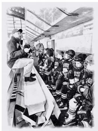
Dernières consignes du coach !