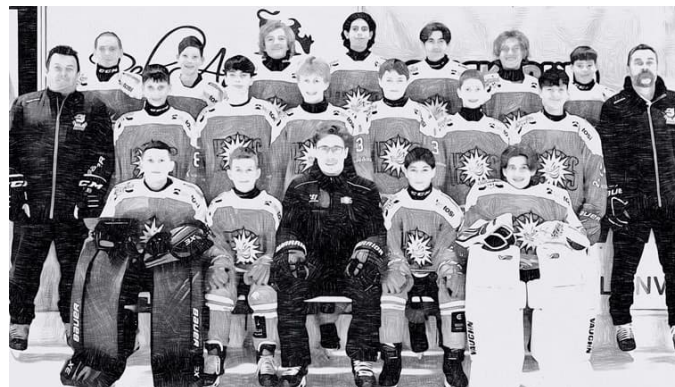
Sous le maillot du HC Sierre, nos juniors ont éprouvé beaucoup de plaisir dans cette équipe.

Une nouvelle et étroite collaboration avec le HC Sierre a été mise en place cette saison en U15 Top. Une première expérience tant pour les joueurs, le staff et les parents qui est unanimement qualifiée de « super ».